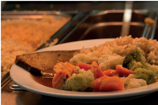
frisch, vegetarisch, regional